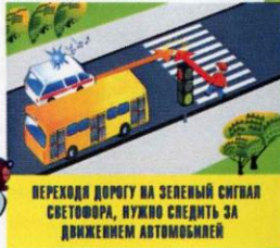
ПЕРЕХОДИ ДОРОГУ НА ЗЕЛЕНЫЙ СИГНАЛ СВЕТОФОРА, НУЖНО СЛЕДИТЬ ЗА ДВИЖЕНИЕМ АВТУБУСОВ