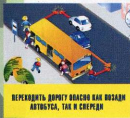
ПЕРЕХОДИТЬ ДОРОГУ ОПАСНО КАК ПОЗАДИ АВТУБУСА, ТАК И СПЕРЕДИ