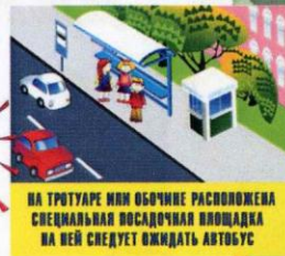
НА ТРОТУАРЕ ИЛИ ОБОЧИНЕ РАСПОЛОЖЕНА СПЕЦИАЛЬНАЯ ВОСАДОЧНАЯ ПЛОЩАДКА НА НЕЙ СЛЕДУЕТ ОЖИДАТЬ АВТУБУС