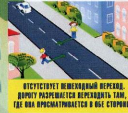
ОТСУТСТВУЕТ ПЕШЕХОДНЫЙ ПЕРЕХОД. ДОРОГУ РАЗРЕШАЕТСЯ ПЕРЕХОДИТЬ ТАМ, ГДЕ ОНА ПРОСМАТРИВАЕТСЯ В ОБЕ СТОРОНЫ

Чтобы возле перекрёстка Ты дорогу перешёл, Все цвета у светофора Нужно помнить хорошо! Загорелся красный свет — Пешеходам хода нет! Жёлтый — значит подожди, А зелёный свет — иди!