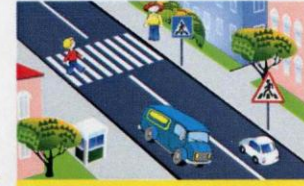
НАЗЕМНЫЙ ПЕШЕХОДНЫЙ ПЕРЕХОД ОБЪЕДИНЯЕТСЯ СПЕЦИАЛЬНЫМИ ДОРОЖНЫМИ ЗНАКАМИ И РАЗМЕТКОЙ

Вот обычный переход. По нему идёт народ. Здесь специальная разметка, «Зеброю» зовётся метко! Белые полоски тут Через улицу ведут! Знак «Пешеходный переход» Где на «зебре» пешеход, Ты на улице найди И под ним переходи!